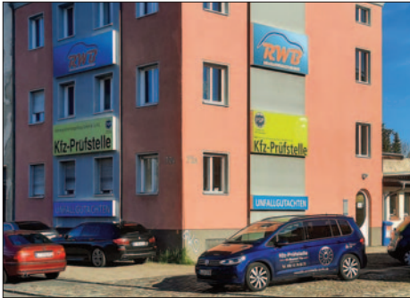
■ Die Kfz-Prüfstelle und das Sachverständigenbüro in Biesdorf erstellen Gutachten und führen Haupt- und Abgasuntersuchungen durch.

ADAC-Mitglieder erhalten hier spezielle Leistungen. Zudem ist die Durchführung von Abgas- und Hauptuntersuchungen als Partner des „TÜV Rheinland“ problemlos möglich. Änderungsabnahmen sowie Begutachtungen von Oldtimern zum Erlangen des H-Kennzeichens, gehören ebenso zum Spektrum. Termine können bequem über die Internetseite gebucht werden.