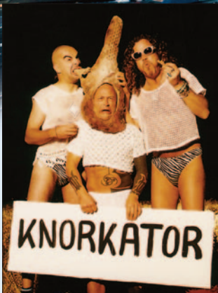
■ „Knorkator“ sorgt seit 1994 für Auftritte, an die man sich erinnert.