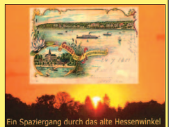
Ein Spaziergang durch das alte Hessenwinkel

Zum Buch: www.leseschau.de/59 • Tel. 030/69 20 21 05