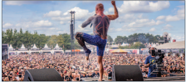
■ Beim Open-Air-Festival 2005 kamen eine halbe Million Besucher.

„Während wir auf unseren deutlich roheren Frühwerken durchaus in die Ecke der ‚Neuen Deutschen Härte‘