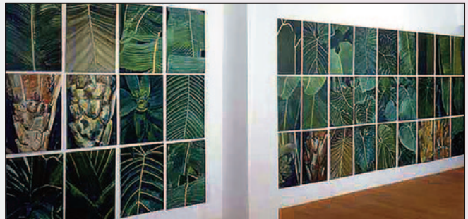
■ Die Friedrichshagener Künstlerin liebt große Werke. Bei der „Grünen Serie“ entstanden 96 Bilder, gemalt in Öl, die am Ende zu einem großen Ensemble zusammengefügt wurden.

Tel. 0 30/30 60 56 90 www.elisabethluechtfeld.de