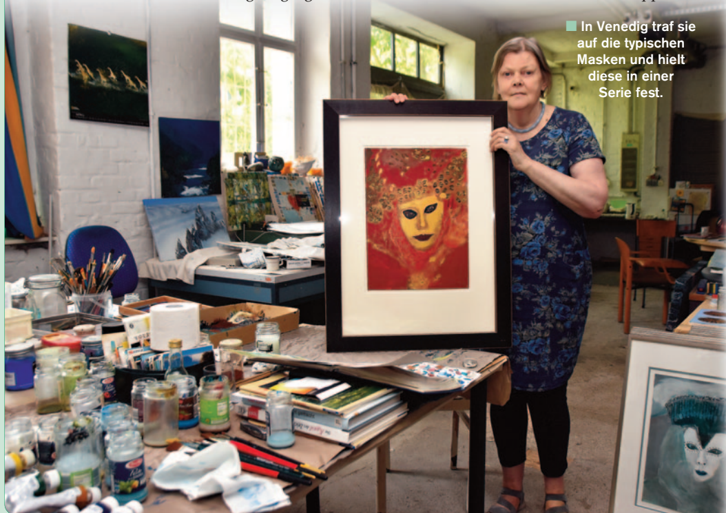
In Venedig traf sie auf die typischen Masken und hielt diese in einer Serie fest.