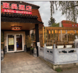
■ „Restaurant Seepalast“ lädt zu asiatischen Genüssen ein.

(Tram 61 Endhaltestelle) Di.-So. 11.30-22 Uhr Tel. 0 30/76 90 55 55 www.seepalast.de